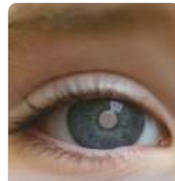
ojo con cataratas