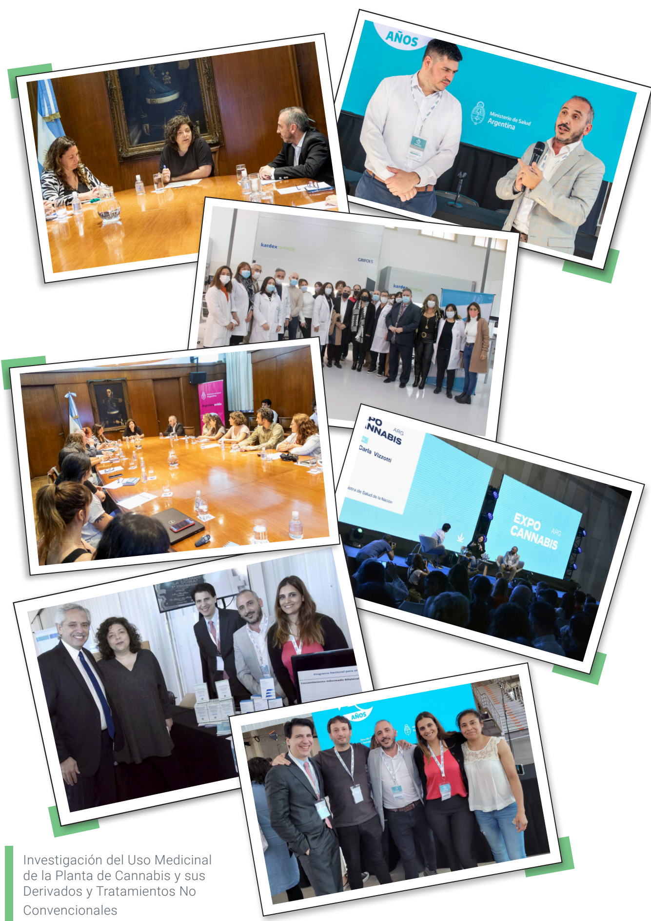
Investigación del Uso Medicinal de la Planta de Cannabis y sus Derivados y Tratamientos No Convencionales