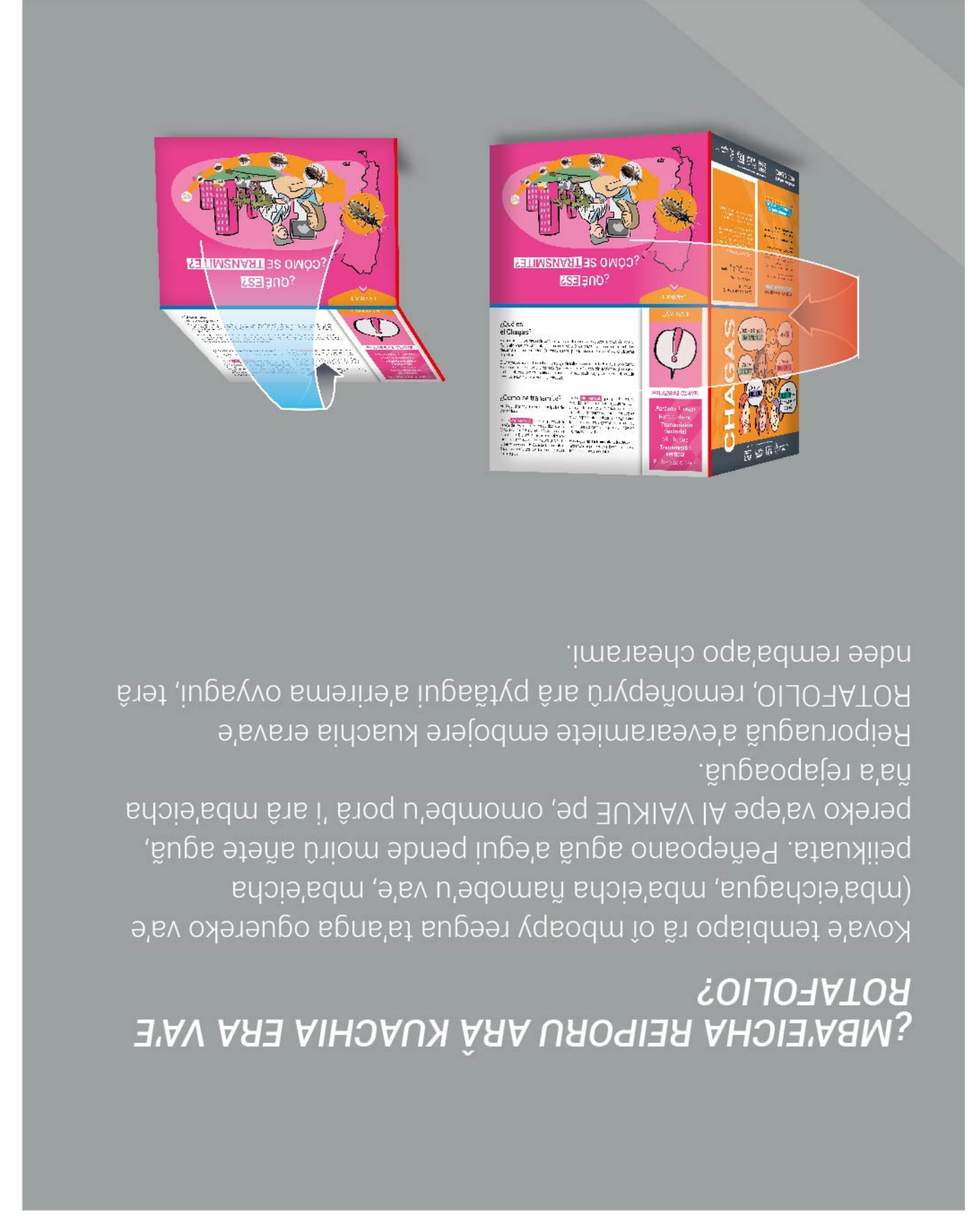
¿MBAEICHA REIPORU ARÂ KUACHIA ERA VAE ROTAFOLIO?

¿Mba'e oguereko ikatuete va'e tete achy va'e AI VAIKUE gui?